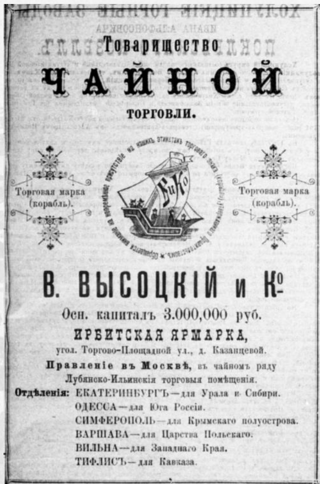
Ирбитский ярмарочный листок, 1901 г.